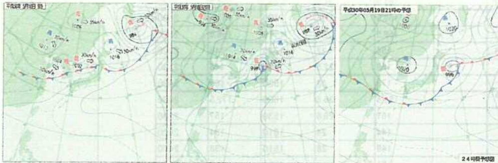
図 左：18日9時の地上天気図 中：18日21時の地上天気図 右：19日21時の予想地上天気図

秋田県では、低気圧や東北地方に停滞した前線の影響で、18日は、24時間降水量が秋田市では記録1位を更新、その他のアメダス観測点でも5月の記録を更新するなど記録的な大雨となりました。19日低気圧は、秋田県に停滞し次第に不明瞭となり、前線はゆっくり南下する見込みです。このため秋田県では19日は弱いながら雨の降りやすい状態が続く見込みです。また、19日は沿岸を中心風が強いでしょう。雄物川では氾濫が発生しています。これまでの雨により水位が上がっている河川や地盤が緩んでいる所があります。引き続き河川の増水や氾濫に厳重に警戒し、土砂災害に警戒してください。